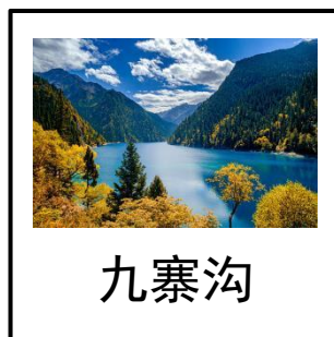
景观卡片示意图(室内示例)